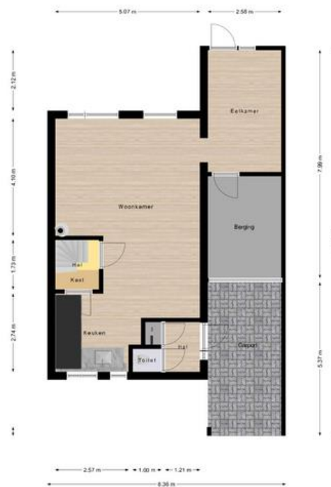
Begane grond De plattegronden zijn opgesteld naar de afmetingen van de afgeleverde platen. Er kunnen kleine afwijkingen in de afmetingen voorkomen.